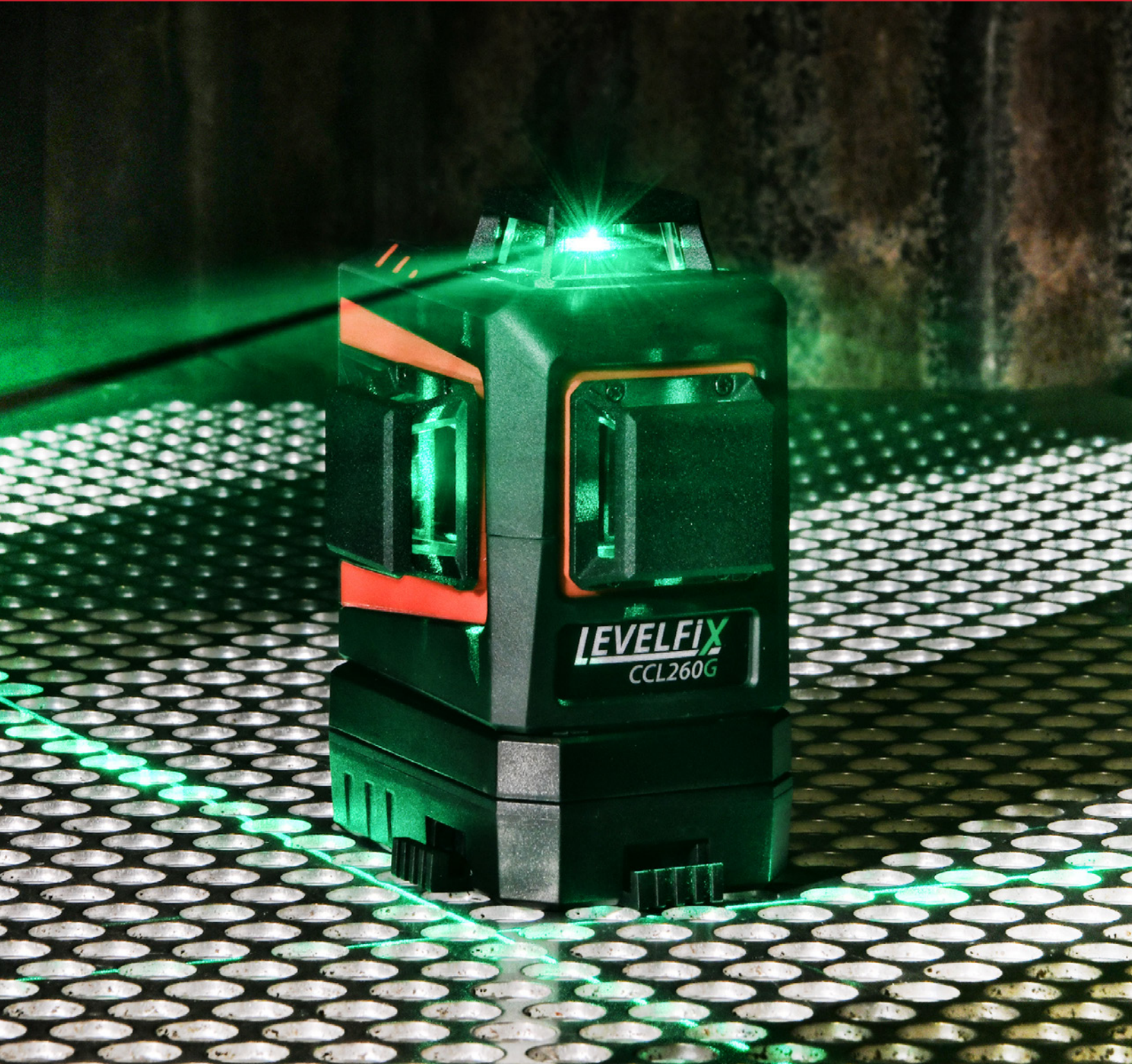
X Levelfix CCL260G Vihreä 3D monilinjalaser 3x360°